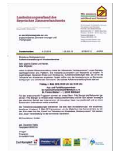
Rundschreiben für Mitglieder