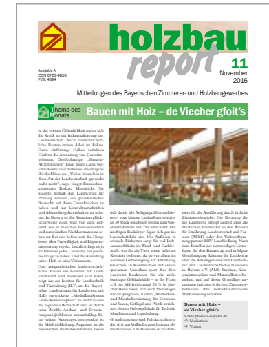
Mitteilungsblatt holzbau report