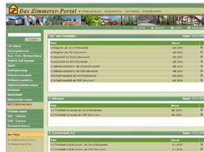
LIV Intern: exklusiver Mitgliederbereich